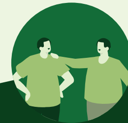
Pas på mennesker